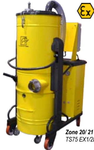
Zone 20/ 21 TS75 EX1/2D

Les produits ATEX sont certifiés pour les zones de risque ATEX 1,2 - 21,22. Tous les modèles sont alimentés par une soufflante à canal latéral qui assure des performances optimales tant en utilisation lourde que continue. L'efficacité de filtration élevée et la large gamme de moteurs est en mesure de satisfaire tous les besoins d'utilisation. Les aspirateurs ATEX Mastervac sont équipés de mise à la terre pour décharger l'électricité statique.