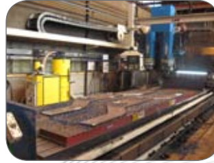
Aspiration des copeaux métalliques