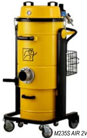
M235S AIR 2V

Cet aspirateur air comprimé est caractérisé comme un modèle compact, fonctionnel et polyvalent, idéal pour la récolte simultanée de poussières et liquides. Disponible avec une ou deux unités Venturi, cet aspirateur air comprimé Mastervac assure d'excellente performance en utilisation continue 24/24. L'absence de composants électriques le rend particulièrement adapté à l'industrie du transport maritime et à bord des navires.