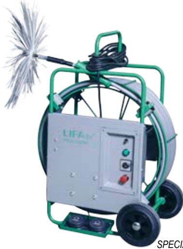
SPECIAL CLEANER 20 PE

Le brosseur spécial Cleaner 20PE est adapté aux nettoyage des gaines de 100 à 500mm