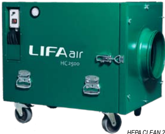
HEPA CLEAN 2500